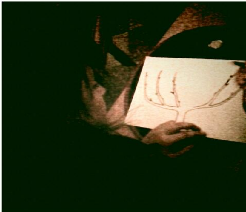
Slika 1: Izdelava dreves z analize osebne razvoja na 6 področjih.

Trditve ovrednotijo od 1 do 5 tako, da pri vsaki trditvi vzamejo najmanj 1 drevesni list oz. največ 5. Ko PP preberejo vse trditve in jih ovrednotijo z 1 do 5 lističi pridejo nazaj na skupni prostor. Tam jih že čakajo listi in pisala... Vsak od PP nariše svoje drevo s 6 vejami in na drevo limajo svoje listke. Vsako področje razvoje je 1 veja in ena barva listkov predstavlja eno področje. Tako na preprost način PP naredijo analizo svoje osebne rasti na 6 področjih razvoja. Svoja drevesa obdržijo do zimovanja.