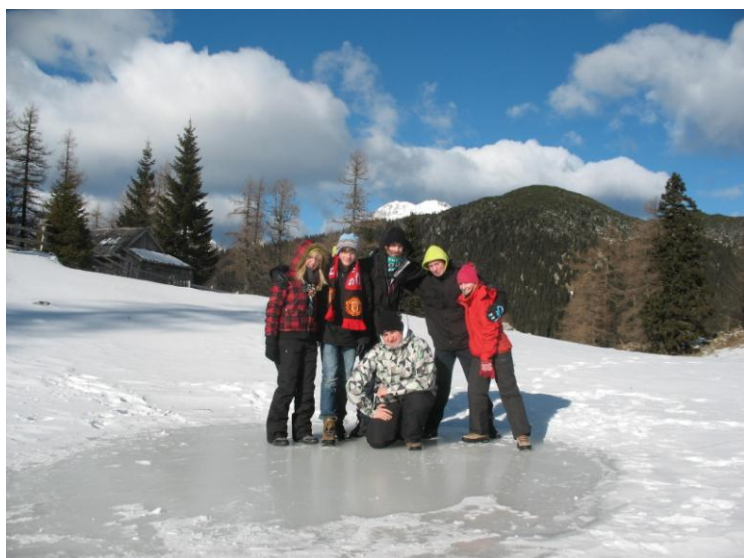
Slika 1: Zimovanje Velika planina

Nepovezanost, zaupanje, skupnost, metodološki pripomočki, odhod.