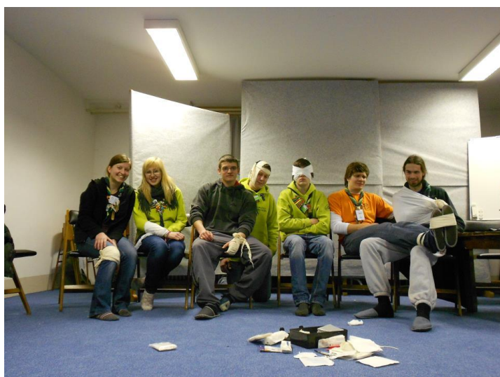
Slika 2: Srečanje-Prva pomoč

Voditeljem bi rekla samo, da naj cenijo že majhne stvari in da naj si vzamejo dovolj časa, da skupaj s PP-jevci zgradijo trdne temelje skupnosti.